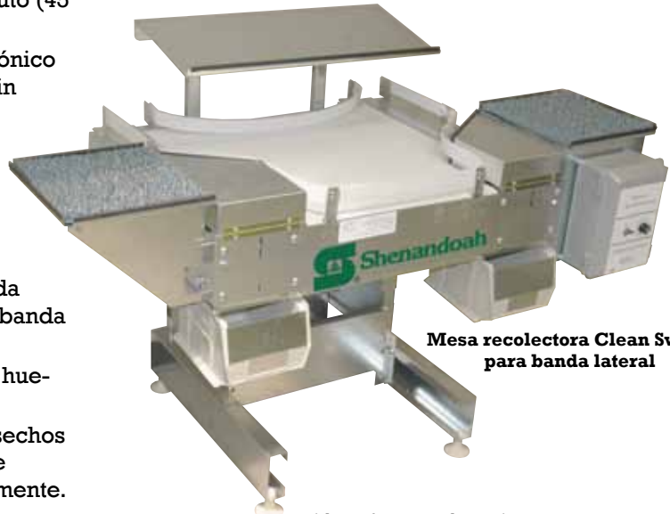
Mesa recolectora Clean Sweep para banda lateral