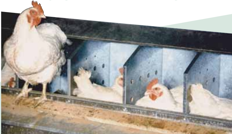
Nido con banda central de Shenandoah®