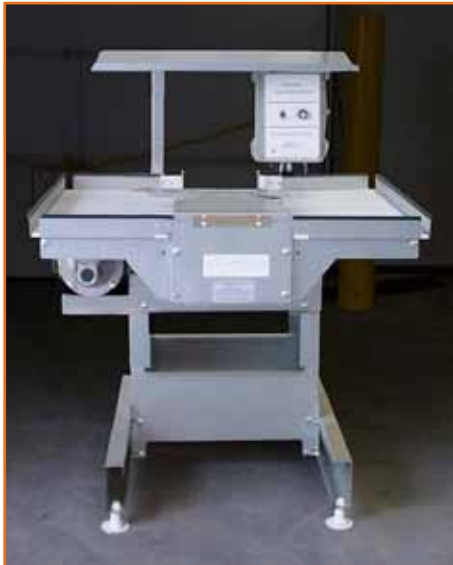
Mesa recolectora Clean Sweep para banda central