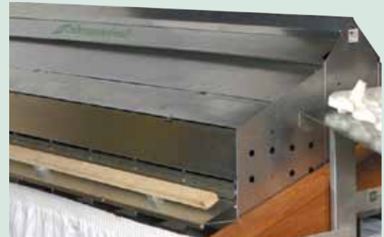
Nido con banda central de Shenandoah®