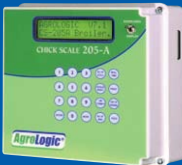
Balanza para Pollos 205 de Agro Logic®