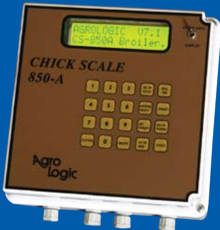
Balanza para Pollos 850 de Agro Logic®

Un líder en el desarrollo de sistemas de control electrónicos para aves desde 1988.