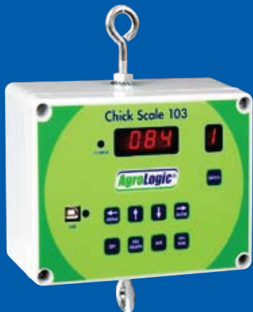
Balanza para pollos Chick Scale 103 de Agro Logic®

Un líder en el desarrollo de sistemas de control electrónicos para aves desde 1988.